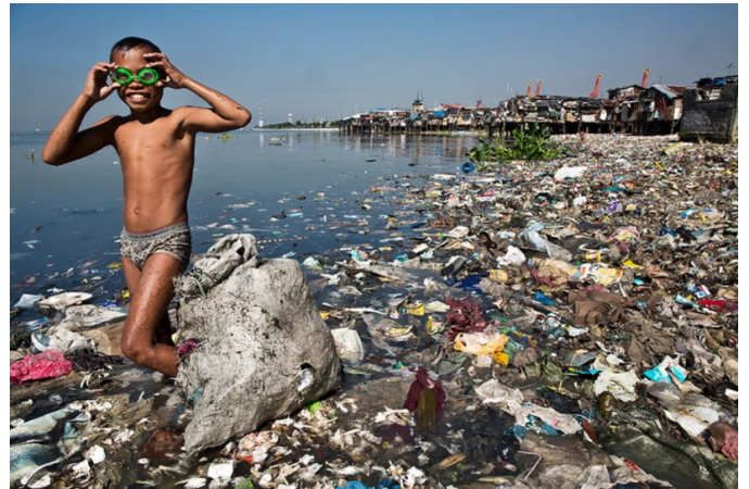
Un enfant d'un pays pauvre... à la baignade !