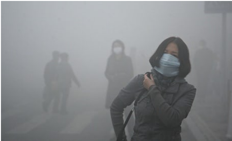
A Beijing (Chine), les gens vont au travail...

Dans nos jardins partagés, nous bannissons les produits toxiques, nous faisons du compost... c'est bien. Et dans notre vie quotidienne, faisons-nous l'effort des petits gestes qui nous permettront de laisser à nos enfants une planète vivable ? Il est urgent d'apprendre aux enfants à respecter notre environnement.